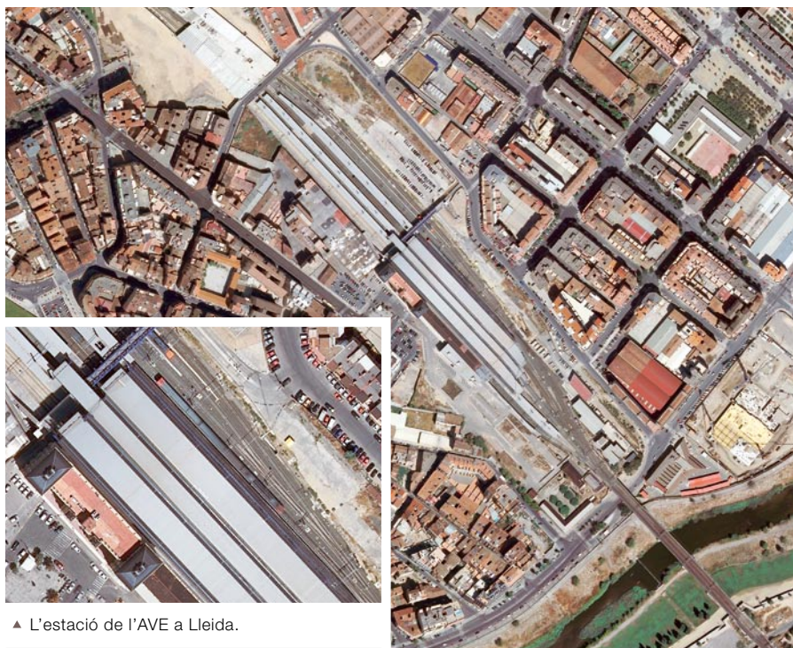
▲ L'estació de l'AVE a Lleida.

Una diferència substancial respecte de la versió anterior (v.4), a banda de l'ús de càmeres digitals, és que s'aconsegueix una millor continuïtat radiomètrica (cromàtica) requerida per a tot el territori. També cal emfasitzar la millora del procés de rectificació geomètrica, que converteix les imatges aèries en do-