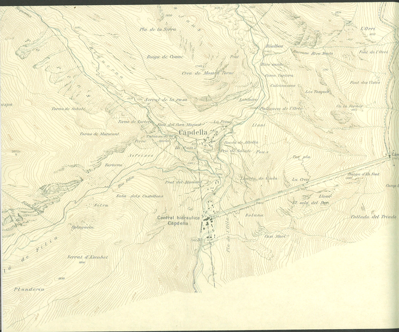
Lagos de Capdella (fragment), 1922, escala 1:10.000. Léo Aegerter. Energía Eléctrica de Cataluña

Els primers mapes pròpiament excursionistes es comencen a publicar a la segona meitat del segle XIX i són de factura molt desigual. Així, per exemple, el 1858 es publica un Plano topográfico de la montaña de Montserrat [no dibuixat a escala] dins de la guia Tres días en Montserrat de C. Cornet y Mas on només es perfilen uns trets molt generals del relleu de la zona. El dibuix és clarament deficient, sobretot si el comparem amb altra cartografia excursionista del Pirineu, com el mapa Monts Maudits publicat a escala 1:80.000 per l'irlandès Charles Packe tot just l'any 1868 amb un dibuix molt més precís. També es van dibuixar mapes més generals com el Mapa del Pirineu Català , obra de Josep Ricart i Giralt que acompanyava la primera edició del poema Canigó de Mossèn Jacint Verdaguer, publicat el 1886. Centrat en el massís del Canigó i amb la incorporació d'algunes cotes altimètriques, el mapa