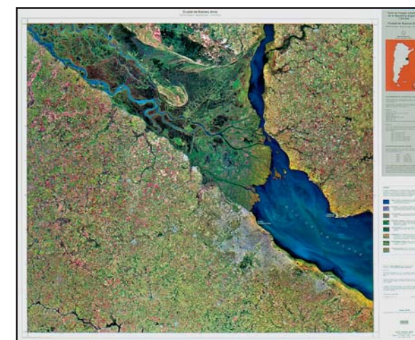
Premi de la ICA/ACI de 1995 a la Carta de imatge satel·litària de la República Argentina 1:250 000, Ciudad de Buenos Aires. Realitzada per l'IGM i elaborada i editada per l'ICC.

Aquest és, doncs, el resum de la visió i de la missió que ens ha conduït en el període de la maduresa. Cal dir que la implementació de les idees en programes i projectes s'ha dut a terme amb uns criteris eficients de servei públic i servei al nostre govern.